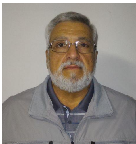
IK2GSJ SIGISMONDO MARAZIA